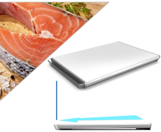
斜めになっていることで水分が流れる（水受けつき）

冷凍した食品をのせるだけで、すばやく解凍。流水や電子レンジによる解凍はいりません。